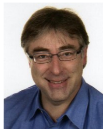
Norbert Wanderer Beitrag Referatsleiter Holbeinstraße